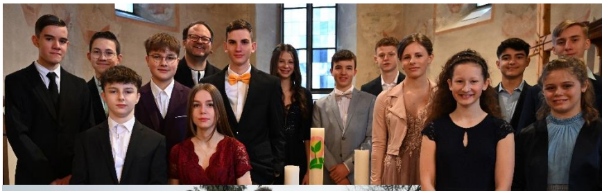
Konfirmation vom 26. März