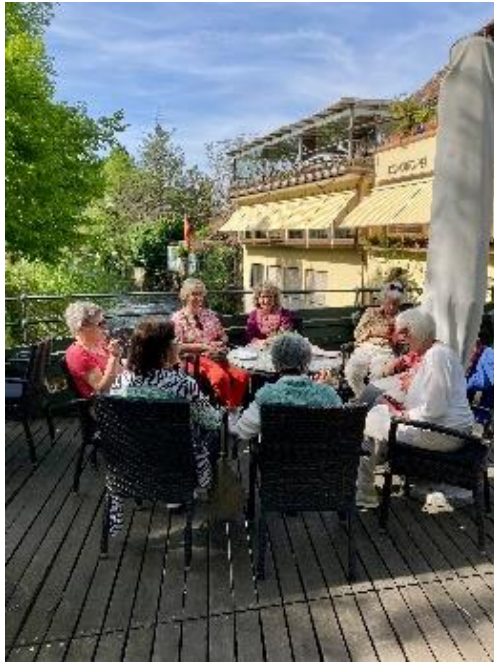
Der gemütliche Ausflug der Altersnachmittag-Gruppe