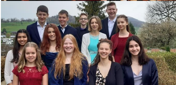
Konfirmation vom 2. April