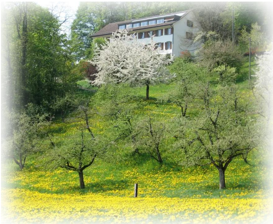
70 Jahre Haus der Stille auf dem Sonnenhof (S. 12)